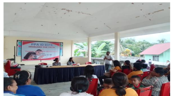
Gambar 3. Kegiatan perkenalan tim dengan anggota PPA ID-0319

Sebelum melaksanakan kegiatan sosialisasi, tim diperkenalkan kepada anggota PPA ID-0319. Perkenalan ini dimaksudkan agar terjalin keakraban antara anggota tim dengan anggota PPA ID-0319.