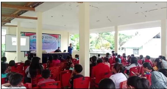
Gambar 4. Sosialisasi kepada anak usia sekolah dasar.

Kegiatan sosialisasi yang pertama dilaksanakan pada hari rabu, 15 Mei 2024. Peserta yang hadir adalah anggota PPA usia sekolah dasar yang berjumlah 27 orang. Kegiatan ini berlangsung di ruang pertemuan terbuka.