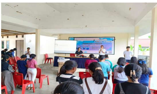
Gambar 5. Sosialisasi kepada anak remaja

Kegiatan sosialisasi yang kedua dilaksanakan pada hari rabu, 22 Mei 2024. Peserta yang hadir adalah anak remaja anggota PPA ID-0319 yang berjumlah 35 orang.