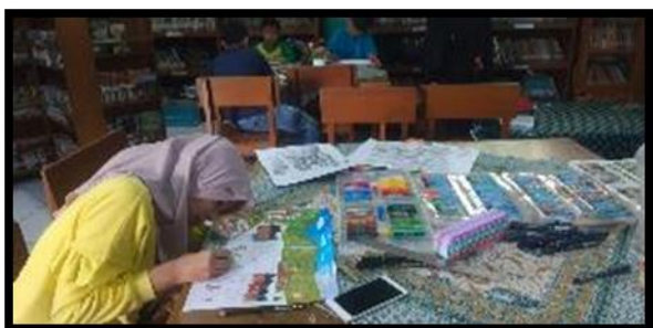
Gambar 4. Siswi menggambar dengan teknik warna carayon