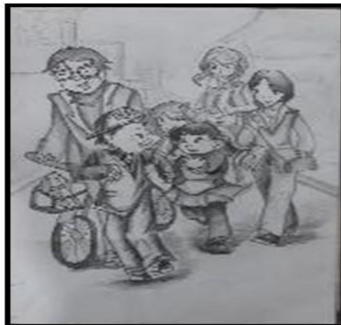
Gambar 6. Hasil gambar dasar menggunakan pensil 3b