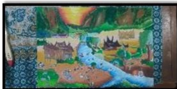
Gambar 8. Hasil gambar yang sudah diwarnai menggunakan crayon