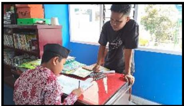
Gambar 3. Pelatih sedang mengamati siswa menggambar