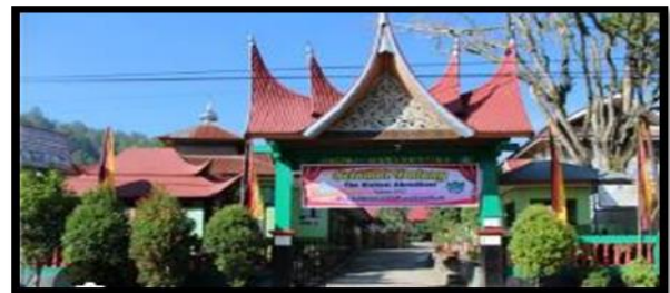
Gambar 1. Sekolah SD 03 payakumbuh

Berikut hasil dan proses pelatihan yang berlangsung.