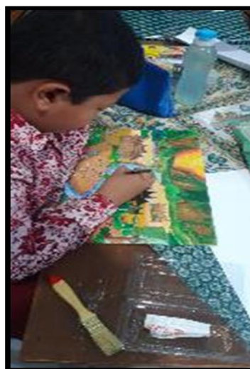
Gambar 7. Proses pewarnaan gambar