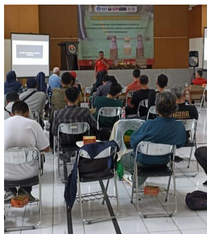
Gambar 1. Proses Pematerian

Kota Tasikmalaya mendapatkan prestasi sebagai peraih Medali Perak. Eksistensi cabang olahraga woodball ini sudah mulai menjadi perhatian pada olahraga prestasi, yang dibuktikan dengan pertama kalinya cabang olahraga woodball dipertandingkan di level nasional pada PON XXI/2024 Aceh-Sumut mendatang (Rohman, 2022).