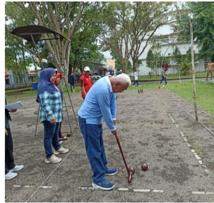
Gambar 3. Proses Praktik Permainan Woodball

Seperti dalam banyak olahraga, woodball memiliki aturan dan peraturan yang harus diikuti. Aturan ini mencakup cara menghitung poin, batasan pukulan, dan berbagai detail lainnya. Dalam woodball, pemain menggunakan palu khusus yang memiliki kepala datar untuk memukul bola kayu menuju lubang. Bola kayu memiliki diameter dan bobot tertentu.