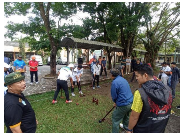
Gambar 4 Proses Praktik Permainan Woodball

Dalam praktik ini peserta diajak untuk merasakan kesenangan dalam olahraga woodball. Olahraga ini dapat menjadi rekreasi karena tidak terlalu memakai lapang yang luas dan permainannya selalu beradaptasi dengan lingkungan sekitar.