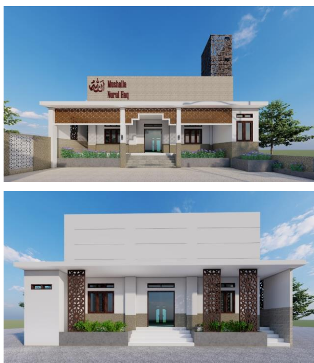
Gambar 5. Rencana desain eksterior musala

Halaman depan perlu dilakukan perbaikan agar memudahkan jama'ah untuk memarkirkan kendaraan. Bangunan juga dilengkapi dengan koridor di samping untuk memberikan ruang transisi antara musala dan ruang di sebelahnya. Koridor ini juga dapat menjadi area beristirahat jama'ah. Penambahan vegetasi juga dilakukan untuk memberikan kesejukan dan kesan asri pada bangunan.