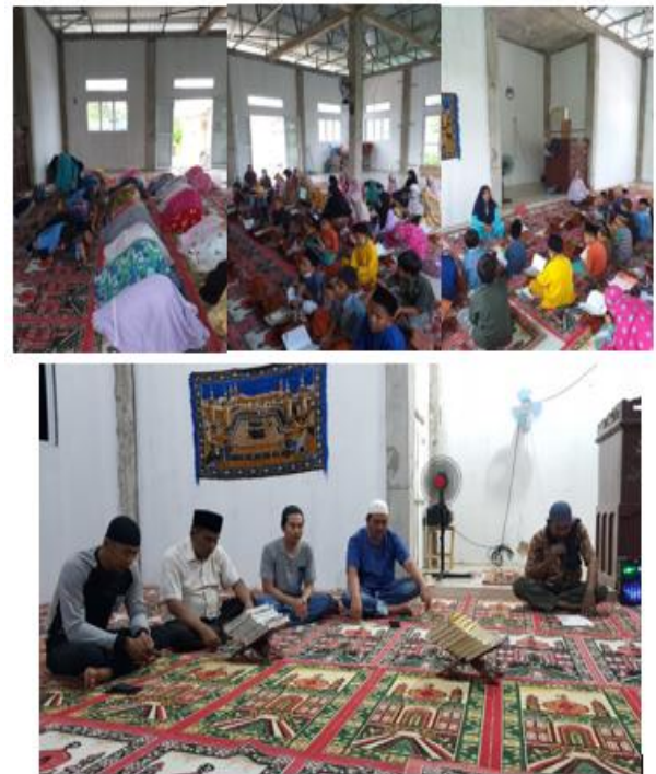
Gambar 1. Kegiatan Musala Nurul Haq saat ini

Kegiatan di Musala Nurul Haq cukup beragam, antara lain solat berjama'ah, dzikir bersama, tempat mengaji anak-anak dan lain sebagainya (Gambar 1).