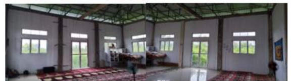
Gambar 3. Kondisi eksisting Musala Nurul Haq

Komponen pembentuk masjid/musala, yaitu antara lain: ruang solat bersama, mimbar, mihrab, tempat wudhu, minaret dan ornamentasi (Sumalyo, 2000). Dekorasi ornamen dapat mengikuti zaman dan budaya suatu masyarakat asal tidak melanggar syariat Islam (seperti meletakkan patung dan sejenisnya yang dilarang dalam Islam).