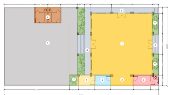
Gambar 4. Rencana denah hasil redesain musala

Komponen pembentuk masjid/musala, yaitu antara lain: ruang solat bersama, mimbar, mihrab, tempat wudhu, minaret dan ornamentasi (Sumalyo, 2000). Dekorasi ornamen dapat mengikuti zaman dan budaya suatu masyarakat asal tidak melanggar syariat Islam (seperti meletakkan patung dan sejenisnya yang dilarang dalam Islam).