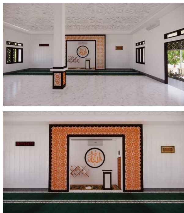
Gambar 6. Rencana desain interior musala

Selain eksterior, perbaikan musala juga dilakukan pada interior bangunan (Gambar 6).