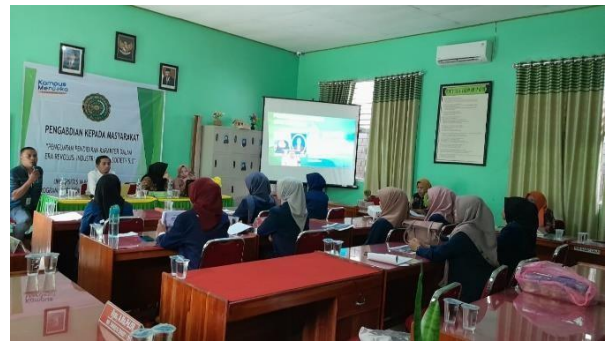
Gambar 1. Tahap Persiapan

Persiapan kegiatan dimulai dari tahap perencanaan yakni pembetulan tim dan menyampaikan kepada pihak sekolah sebagai mitra Kerjasama sekaligus mendesain bentuk kegiatan dan persiapan pelaksanaan kegiatan. Selain itu kegiatan ini dimulai dari tahap persiapan tempat pelaksanaan, waktu dan media yang dipersiapkan adalah pihak sekolah mitra yakni SD Negeri 2 bataraguru.