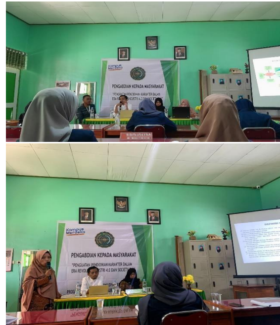
Gambar 2. Pemberian Materi

Kegiatan PKM yang dilakukan di SD Negeri 2 bataraguru berjalan dengan baik, dan hasil evaluasi kegiatan yang tercapai adalah salah satunya adanya beberapa guru yang sangat antusias melemparkan pertanyaan yang terkait dengan karakter, bagaimana cara membangun karakter siswa didalam pembelajaran di kelas maupun kegiatan apa saja yang dapat membangun karakter anak didik. Kemudian hasil monitoring selanjutnya adalah guru-guru yang ada di SD Negeri 2 Bataraguru sudah mulai melakukan kegiatan ekstrakurikuler bidang keagamaan seperti tadarus Al-qur'an setiap jumat pagi, baca Yasin secara berjamaah. Hal ini sangat berdampak positif terhadap penanaman karakter terhadap peserta didik.