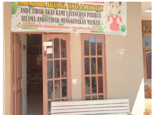
Gambar 1. Mitra PMB Ika Putri Ramadhani, M.Biomed

faktor yang berhubungan dengan kejadian ruptur perineum yaitu massage uterus (p value 0.031 dengan nilai OR=4.667, artinya ibu yang tidak melakukan massage perineum mempunyai peluang 4.67 kali untuk mengalami ruptur perineum (Rohani, 2014).