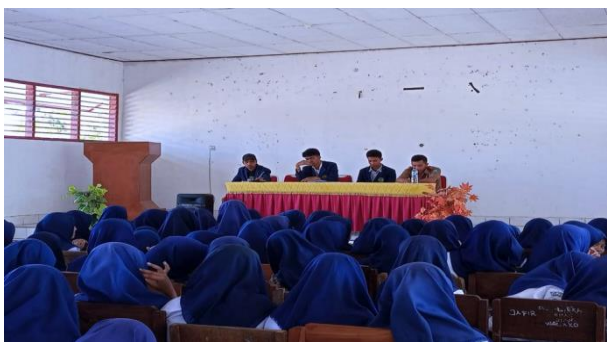
Gambar 2. Kegiatan Pembukaan

Kelurahan watulea merupakan salah satu Desa yang terletak di Kecamatan GU Kabupaten Buton Tengah. Secara umum karakteristik wilayah Kelurahan Watulea dapat dilihat dari aspek fisik yang meliputi letak, luas, topografi dan kondisi iklim. Kelurahan Watula merupakan pusat administrasi Kabupaten Buton Tengah. Kelurahan Watulea, Kecamatan GU, Kabupaten Buton Tengah memiliki banyak potensi yang perlu dikembangkan dan diberdayakan. Oleh karenanya kami merasa terdorong untuk mengabdikan ilmu yang kami miliki melalui program Kegiatan Kuliah Kerja Nyata (KKN) yang dilakukan mahasiswa diharapkan dapat memberikan dampak positif kepada masyarakat secara umum khususnya pendidikan.