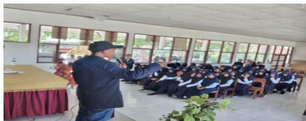
Gambar 3. Kegiatan Penyampaian Materi PKM