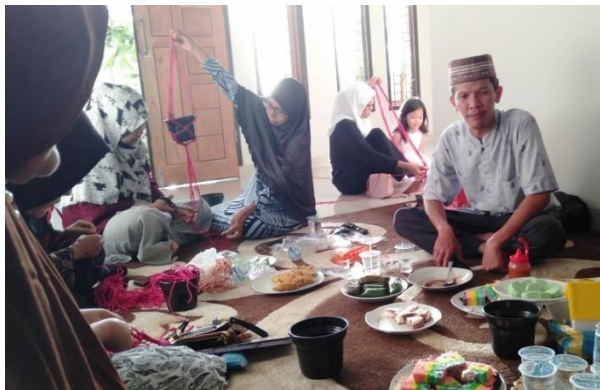
Gambar 9. Suasana pelatihan yang dihadiri Ketua RT sebagai dukungan terhadap kegiatan