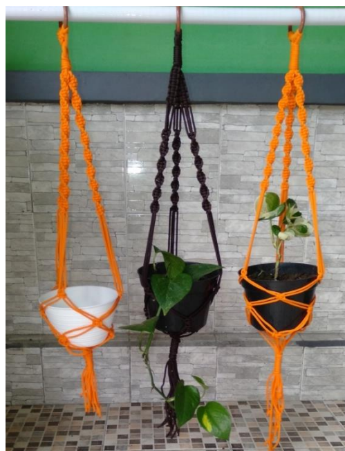
Gambar 11. Karya hasil kreativitas peserta pelatihan dalam variasi bentuk dua gantungan pot