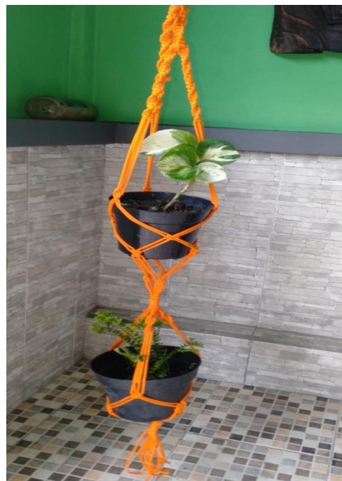
Gambar 10. Karya hasil kreativitas peserta pelatihan dalam variasi bentuk dua gantungan pot

Semua proses dan tahapan kerja dalam perwujudan produk mulai dari awal persiapan sampai akhir dapat dilaksanakan dengan baik. Selama pelaksanaan pelatihan masing-masing peserta menghasilkan satu produk. Selama proses kegiatan diselingi dengan diskusi dan tanya jawab. Berikut adalah sebagian hasil kreasi mitra peserta pelatihan pembuatan gantungan pot bunga yang dibentuk dengan teknik makrame.