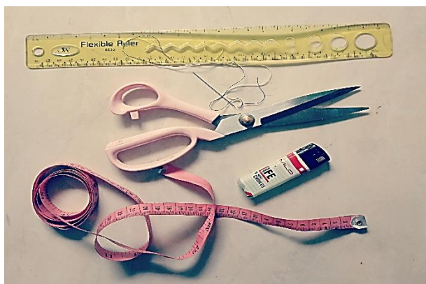
Gambar 5. Alat kerja sebagai pendukung dalam pembentukan karya makrame berupa