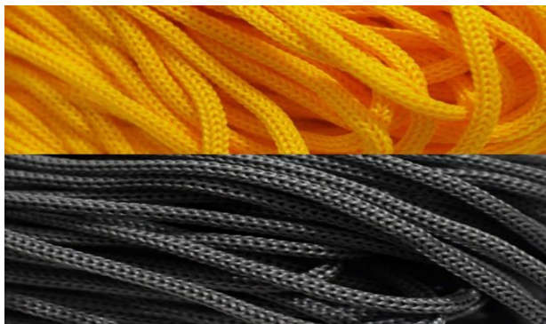
Gambar 2. Detail serat tali kur