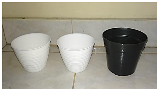
Gambar 4. Pot bunga plastik yang akan digantung dengan gantungan teknik makrame

Selain medium sebagai bahan, pembuatan karya juga didukung dengan ketersediaan peralatan kerja untuk kelancaran proses kerja pembentukan maupun finising karya. Alat kerja dalam pembuatan karya dengan teknik makrame merupakan peralatan sederhana yang banyak terdapat dan digunakan dalam keseharian. Peralatan tersebut berupa meteran, penggaris, gunting, jarum dengan benang jahit, dan korek api yang digunakan untuk mematkan ujung tali kur dengan cara dibakar. di samping itu juga disiapkan alat-alat kerja yang sifatnya insidental tergantung kebutuhan dalam pembentukan karya.