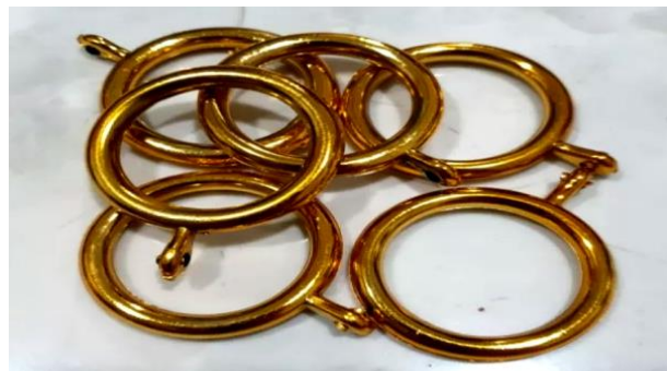
Gambar 3. Ring plastik untuk gantungan karya, biasanya digunakan sebagai gantungan gorden.