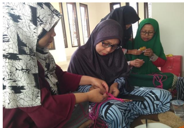
Gambar 7. Proses membuat gantungan pot bunga