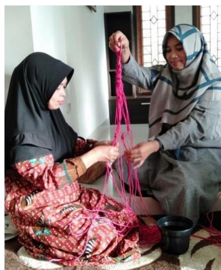
Gambar 8. Proses membuat gantungan pot bunga