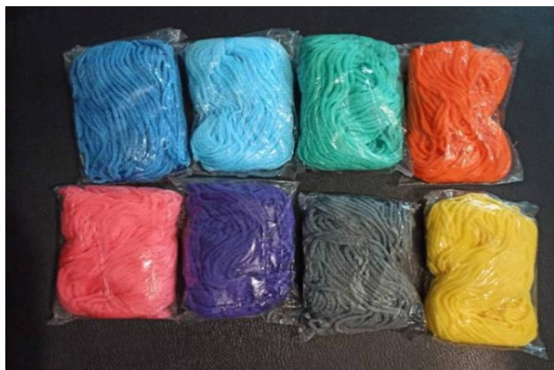
Gambar 1. Bahan utama berupa tali kur.

Pembuatan karya makrame menggunakan bahan atau medium utama berupa tali. Tali sebagai bahan dapat terbuat dari bahan jenis cotton, nylon, tali rami, polyester, kulit hingga linen. Adapun medium atau bahan utama yang digunakan dalam pelatihan ini adalah tali kur. Tali ini digunakan untuk membuat gantungan dengan teknik makrame, pot bunga, dan ring plastik.