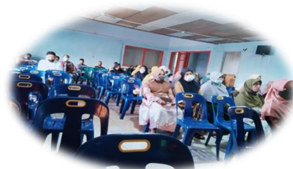
Gambar 4. Dokumentasi Musyawarah keterlibatan masyarakat dalam program Yayasan

Dalam pelaksanaan kegiatan syuro tim inti terdiri dari 7 orang, sedangkan dalam Syuro Badan pengurus harian terdiri dari 20 orang, yang terdiri dari kepala unit dan perangkat, bendahara unit dan tata usaha unit.