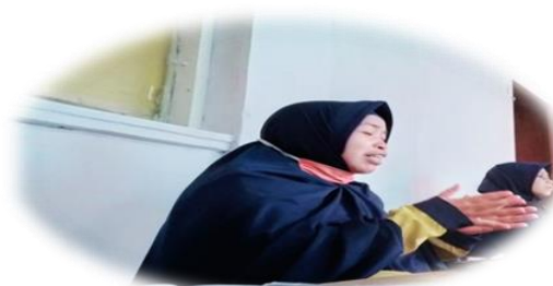
Gambar 2. Wawancara dan Observasi dengan Ketua Yayasan Generasi Gemilang Takengon

ditemukan dengan cara observasi dan wawancara dengan ketua yayasan dan Badan Pengurus Harian. Dari hasil observasi dan wawancara yang penulis dapatkan adalah ketika melakukan musyawarah dari segi waktu yang harus di set sedemikian rupa karena peserta syuro adalah sebagian besar adalah pengurus unit.