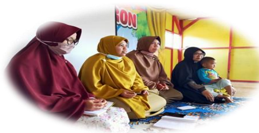
Gambar 3. Dokumentasi Pelaksanaan Sosialisasi dengan Ketua Yayasan dan BPH

Pada tahap penulis melakukan sosialisasi dengan cara mengajak bahwa pentingnya syuro dalam memutuskan permasalahan atau membuat kebijakan. Penulis juga berkordinasi dengan ketua yayasan dan badan pengurus harian bahwa kegiatan syuro ini maksimal satu minggu dilakuan 2 kali pertemuan baik adanya masalah ataupun membuat kebijakan baru.