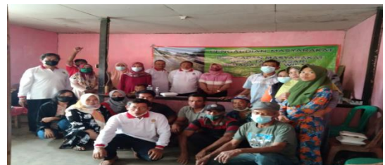
Gambar 2. Peserta Kegiatan Pengabdian Masyarakat