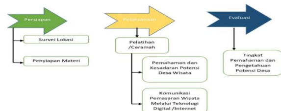
Gambar 3. Alir Metode Kegiatan