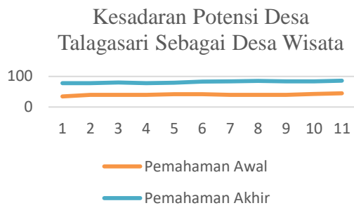
Gambar 4. Peningkatan Kesadaran