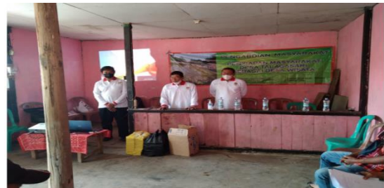
Gambar 1 Balai Pertemuan Desa Talagasari

era 4.0 dalam industri pariwisata penting. Hadirnya platform digital yang secara spesifik bergerak dibidang pariwisata, seperti Livein ataupun Tripadvisor memudahkan terjadinya transaksi pariwisata antara pengelola pariwisata dengan wisatawan. Penelitian mengenai transformasi peran teknologi komunikasi dalam industri pariwisata menemukan bahwa hadirnya teknologi komunikasi telah merubah industri pariwisata sebagai layanan dalam kesatuan ekosistem (Buhalis, 2020).