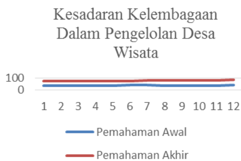
Gambar 5. Peningkatan Kesadaran