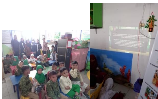
Gambar 1. Kegiatan Mendongeng

pendekatan emosional antara guru dan siswa. Pada saat kegiatan mendongeng, cerita dibacakan dengan tehnik dramatisasi dengan menirukan gaya tokoh dalam dongeng dengan mimik muka dan Gerakan yang sesuai dengan alur cerita, sehingga pesan tersampaikan sesuai dengan amat yang terkandung dalam cerita, sebagai bentuk nasehat yang tersampaikan dengan penuh kasih sayang dan kelembutan.