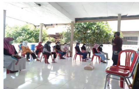
Gambar 2. Sesi Diskusi

Setelah dilakukannya penyuluhan dan pelatihan bantuan hidup dasar tercapainya target yang diharapkan yaitu :