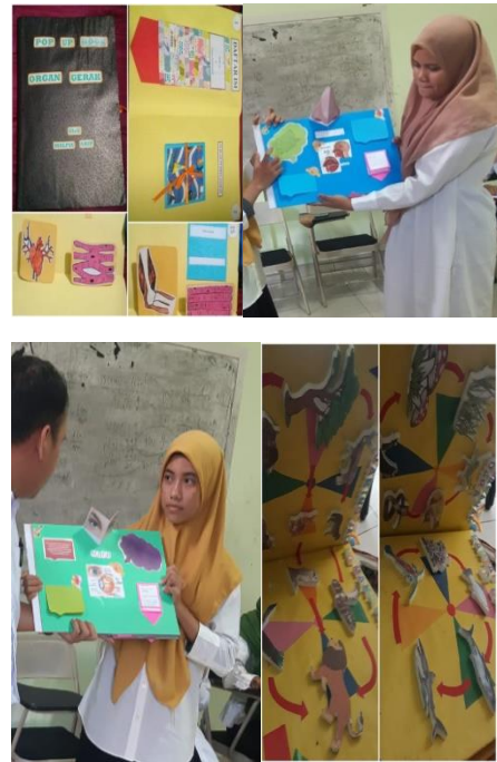
Gambar 2: media Pop up book

jenis gambar, ukuran, warna, font tulisan, dan konten.