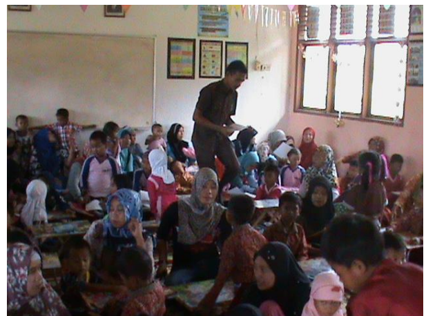
Gambar 4. Peserta Melakukan Praktek Kegiatan Parenting