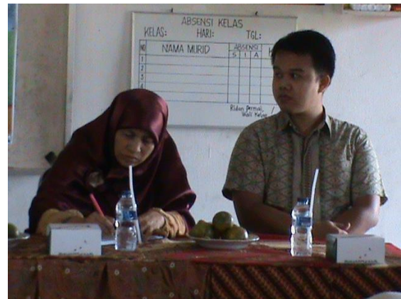
Gambar 2. Menandatangani Kerjasama dengan Mitra

Lebih lanjut kepala Desa menjanjikan untuk tahun kedua pelaksanaan PPDM akan berupaya untuk mencari dana tambahan dari Badan Usaha Milik Desa (BUMDES) dan juga dari dana desa yang dialokasikan khusus untuk pengembangan pendidikan. Melalui perangkat desa yang dimiliki Kepala Desa juga mengupayakan untuk pengajuan bantuan dana kepada Pemerintah Kabupaten Kampar dalam mensukseskan kegiatan parenting terhadap masyarakat Tanah Tinggi