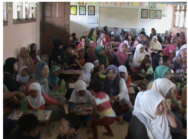
Gambar 3. Peserta PkM Serious Mendengarkan Penjelasan Materi