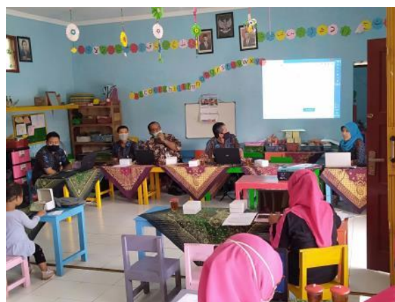
Gambar 1. Penyambutan Kegiatan

Kegiatan awal pada pengabdian kepada masyarakat dimulai dengan kata penyambutan oleh ketua tim pengabdian dari Universitas STEKOM. Acara kemudian dilanjutkan penyampaian tujuan dan sasaran yang akan dicapai dari kegiatan ABDIMAS ini, dimana penggunaan teknologi website khususnya media pemasaran dan pengenalan website untuk sekolah.