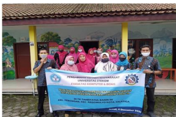
Gambar 4. Sesi Foto Bersama