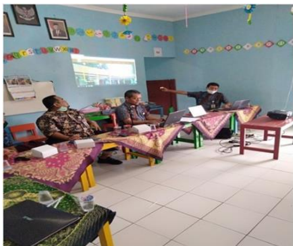
Gambar 2. Penjelasan Kegiatan

perihal mengenai hosting , dan website akan dijelaskan pada awal penyampaian materi. Website atau juga dapat disebut web, dapat diasumsikan bentuk dari halaman yang terdiri beberapa halaman yang berisi informasi data digital yang berupa text, gambar, audio, video, dan animasi lainnya yang dapat disediakan melalui jaringan internet. Website juga merupakan apa yang dapat dilihat via browser, sedangkan yang dikatakan web sebenarnya merupakan sebuah aplikasi web, dikarenakan melakukan perintah tertentu dan membantu untuk melakukan kegiatan tertentu (Josi, 2017).