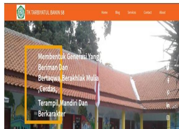
Gambar 5. Website Company Profile Home