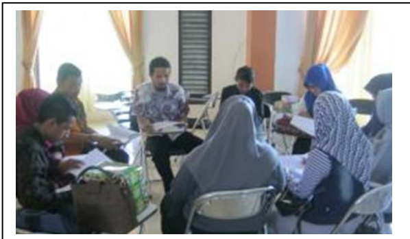
Gambar 4. Pendampingan Menulis Kreatif Secara Berkelompok Pada Peserta

akan diisi dengan ide-ide yang ada di dalam otak mereka. Ide-ide tersebut dituliskan dengan beberapa kata kunci. Setelah itu peserta diminta untuk menentukan ide yang akan dipakai dalam tulisan dengan memberikan kode tertentu. Sedangkan ide yang tidak cocok dengan tema tulisan dapat dibuang.