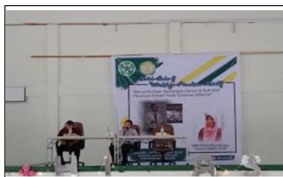
Gambar 2. Presentasi Materi Oleh Tim

Pada kegiatan ini memberikan penjelasan kepada peserta cara menemukan ide kreatif dalam menulis. Ide kreatif mampu dihasilkan oleh setiap manusia dengan cara mereka masing-masing. Tulisan yang kreatif dapat membuat para pembaca tertarik untuk menuntaskan bacaan buku mereka. Banyak orang yang mengalami kesulitan dalam menemukan ide dalam menulis buku. Mereka mencari sesuatu yang jauh tidak mudah dijangkau padahal mereka dapat menemukan ide dari kehidupan sekitar mereka. Berikut ini disampaikan beberapa tips untuk mendapat ide kreatif dalam menulis yaitu a) kejadian yang dialami; b) bidang yang dikuasai; c) pengalaman orang lain; d) sesuatu yang tengah viral/ booming ; e) hobi; dan f) tontonan film dan buku.