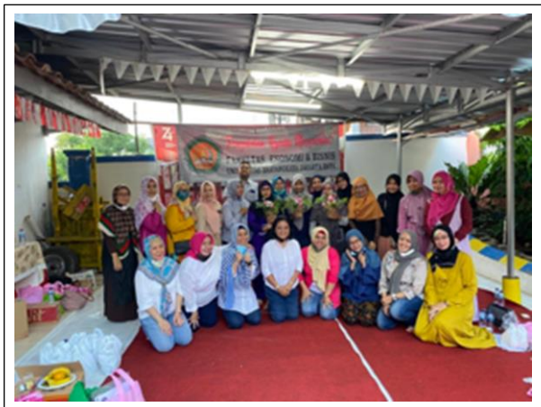
Gambar 3. Peserta dan Narasumber

Tahap pelaksanaan awal, tinjauan pemetaan sementara pengisian kuesioner diperoleh hasil 66% peserta dikategorikan sebagai kelompok telah melakukan perencanaan dan pengelolaan keuangan, dan sisanya 34% dikategorikan kelompok ibu yang perlu bimbingan pelatihan dan pemahaman terkait pengelolaan keuangan. Pada tahapan ini, ditemukan hampir lebih dari sebagian peserta terdapat keraguan dalam memutuskan apakah aktivitas yang dilakukan tergolong dalam kebutuhan ( needs ) atau keinginan ( wants ). Tidak dipungkiri, pola konsumtif salah satunya yang terjadi pada masyarakat merupakan dampak yang dihadapi ketika teknologi makin mudah diadaptasi, sehingga terkadang menjadi suatu hal yang sulit untuk membedakan mana yang tergolong kebutuhan ( needs ) dan mana yang keinginan ( wants ), mana kebutuhan yang sifatnya primer, sekunder maupun tersier. (Mulyanti & Nurdin, 2018).