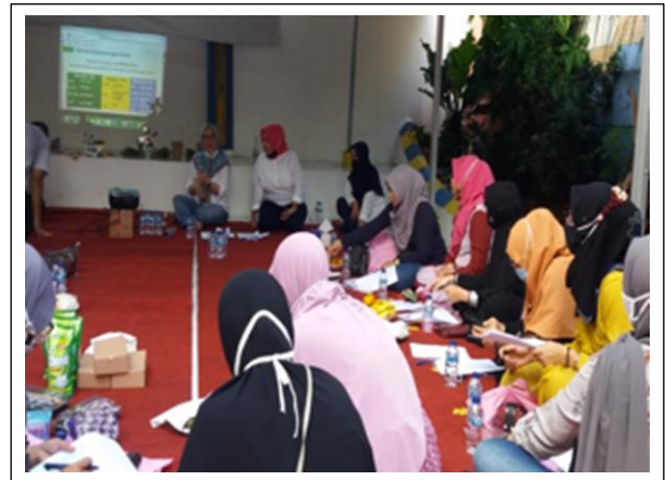
Gambar 4. Edukasi Pelatihan

menguji pengaruh tingkat kesadaran masyarakat terhadap kesejahteraan perencanaan keuangan keluarga (Wulandari & Sutjiati, 2014).