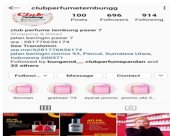
Gambar 2. Tampilan Media Promosi Online Klub Parfum Bandar Klippa

Seperti dijelaskan di atas bahwa strategi pemasaran yang digunakan adalah dengan promosi toko dan prodak dan toko dilakukan secara online melalui instagram dan email, serta pomosi konvensional. Tampilan media publikasi konvensional yang diletakan di sepeda motor antar jemput pesanan pelanggan untuk Klub Parfum 9 Tembung maupun Klub Parfum Bandar Klippa.