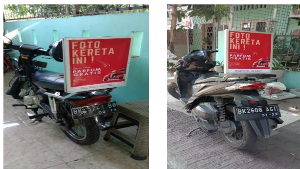
Gambar 3. Tampilan Media Publikasi Konvensional Di Sepeda Motor Antar Jemput

Tujuan umum kegiatan ini yaitu untuk merancang, melatih dan memberikan pendampingan dalam peningkatan pendapatan ekonomi dua UKM club parfum Deli Serdang. Tujuan ini menjadi dasar peningkatan pendapatan UKM mitra dan terus mendorong dalam meningkatkan tarap hidup masyarakat. Selama kegiatan pendampingan terjadi peningkatan omset anatra 7 juta sampai 8 juta per bulan. Guna mencapai tujuan jangka pendek tersebut, maka kegiatan berikutnya yakni membantu merancang kemasan yang menarik dan mampu mempersuasi para pembeli (akan diusulkan pada pengabdian masyarakat tahap berikutnya).