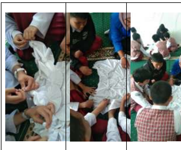
Gambar 1.Praktek pembuatan ikat pada kain ( Oleh : Desi, 2025 )

Pola ikat juga ini memberikan keunikan visual pada kain dan memberikan identitas artistik. Bagian yang terikat atau terkikis tidak akan terpapar pewarna dengan intensitas yang sama seperti area yang tidak terikat. corak yang muncul pada kain, dihasilkan dari konsistennya para peserta dalam mengikat dan membentuk pola pada kain. Pola ikat ini memperkaya keindahan dan keunikan dari karya seni tekstil tersebut. Mereka mencerminkan keahlian tangan, imajinasi, dan kreativitas dari seniman atau perajin dalam hal ini siswa-siswa peserta pelatihan yang membuatnya. berikut gambar pencelupan kain yang dilaksanakan.