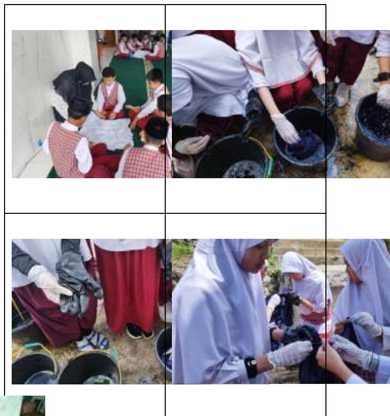
Gambar 2.Praktek pencelupan warna pada kain (Oleh : Desi, 2025)

Distribusi warna yang dilakukan oleh peserta pelatihan juga mempengaruhi hasil pada komposisi warna yang digunakan, memberikan efek terhadap kecerahan kain. Banyak peserta pelatihan memilih untuk menggunakan warna merah dan warna biru pada kain yang mereka buat. Setiap peserta pelatihan