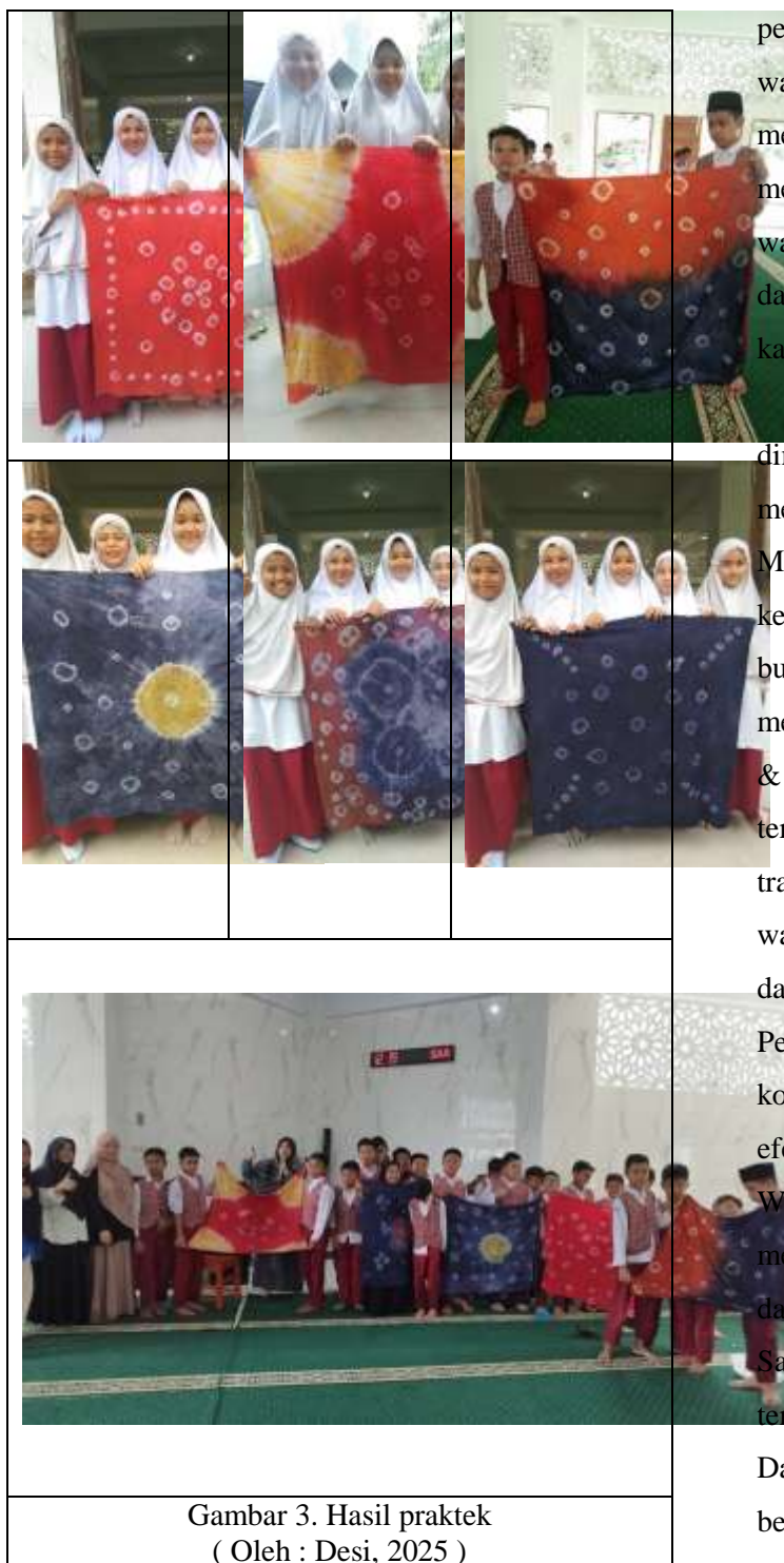
Gambar 3. Hasil praktek ( Oleh : Desi, 2025 )

memilih untuk menggunakan warna merah dalam kain yang dipadukan dengan warna- warna lainnya. selain warna merah, para peserta juga gemar untuk menggunakan warna biru gelap sebagai warna utama dalam kainnya. berikut hasil pewarnaan yang telah dilakukan oleh para peserta pelatihan.