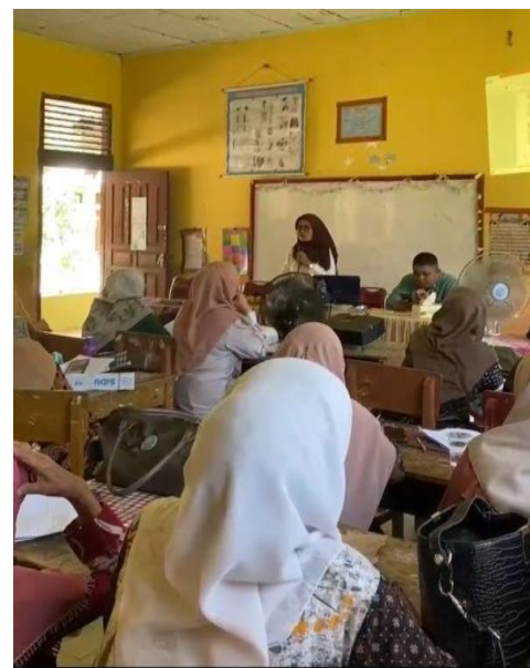
Gambar 3. Pengenalan Project dan Mengintegrasikan Nilai Peduli Lingkungan

Untuk memperkuat pemahaman, kegiatan dilanjutkan dengan diskusi interaktif mengenai pentingnya membangun kesadaran siswa tentang hak-hak mereka, seperti menjaga batasan tubuh, berani berkata “tidak” dalam situasi berisiko, serta melapor kepada orang dewasa yang dipercaya. Pada tahap ini, guru juga diberikan modul dan materi pendukung yang berisi contoh cerita, teknik penyusunan alur, dan panduan praktis storytelling agar lebih mudah diimplementasikan dalam kegiatan belajar mengajar sehari-hari.