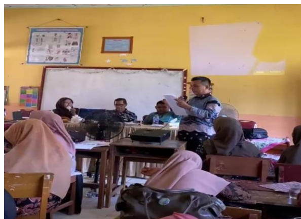
Gambar 4. Guru Saling Bertukar Ide Project dan Mengintegrasikan Nilai Peduli Lingkungan

Selain itu, fasilitator memberikan masukan dan umpan balik terkait efektivitas rencana yang dibuat, baik dari segi konten cerita maupun strategi penyampaian. Proses ini kemudian dilanjutkan dengan demonstrasi dan simulasi praktik storytelling, di mana para guru memvisualisasikan bagaimana cerita akan disampaikan di kelas. Dengan cara ini, guru tidak hanya memahami konsep, tetapi juga memiliki keterampilan praktis dalam mengimplementasikannya secara nyata di pembelajaran sehari-hari.