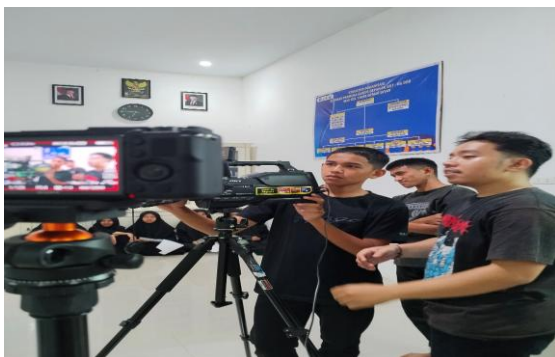
Gambar 7. Praktek Pengambilan Video