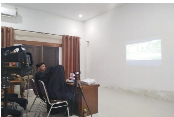
Gambar8. Praktik Editing

Hasil kegiatan ini menegaskan bahwa integrasi media digital mampu menjadi solusi strategis untuk mengatasi keterbatasan yang dihadapi Komunitas Teater Trisud, khususnya minimnya pelatih dan berkurangnya intensitas latihan. Kehadiran teknologi tidak hanya