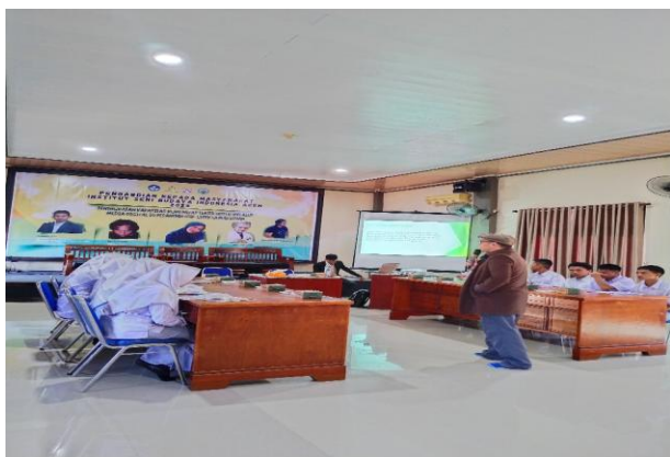
Gambar 2: Narasumber menyampaikan materi

Narasumber pertama memberikan materi tentang pengenalan teater yang mencakup komponen utama pementasan, antara lain aktor, naskah, sutradara, tata panggung, penonton, serta keterampilan akting dasar, termasuk ekspresi wajah, pergerakan tubuh, penggunaan vokal, dan improvisasi. Peserta terlihat fokus mendengarkan materi dan menunjukkan antusiasme tinggi saat sesi tanya jawab berlangsung.