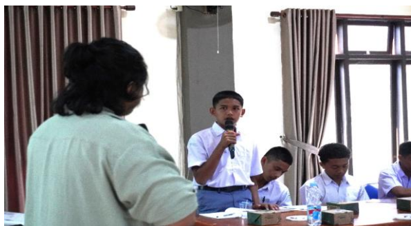
Gambar 3: Sesi Tanya Jawab