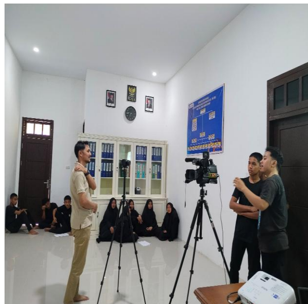
Gambar 5. Penyampaian materi pembuatan video

Pada hari berikutnya, peserta dibagi ke dalam dua kelompok, yaitu kelompok aktor dan kelompok videografer. Sebelum memasuki sesi praktik, peserta terlebih dahulu memperoleh pembekalan mengenai pembuatan video pembelajaran. Rangkaian kegiatan dimulai dengan penyampaian materi secara teoritis, kemudian dilanjutkan dengan praktik pengambilan gambar sesuai peran masing-masing kelompok, dan diakhiri dengan sesi penyuntingan video sebagai implementasi dari materi yang telah diperoleh.