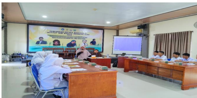
Gambar 1: Ketua PKM menyampaikan laporan kegiatan.

Narasumber pertama memberikan materi tentang pengenalan teater yang mencakup komponen utama pementasan, antara lain aktor, naskah, sutradara, tata panggung, penonton, serta keterampilan akting dasar, termasuk ekspresi wajah, pergerakan tubuh, penggunaan vokal, dan improvisasi. Peserta terlihat fokus mendengarkan materi dan menunjukkan antusiasme tinggi saat sesi tanya jawab berlangsung.