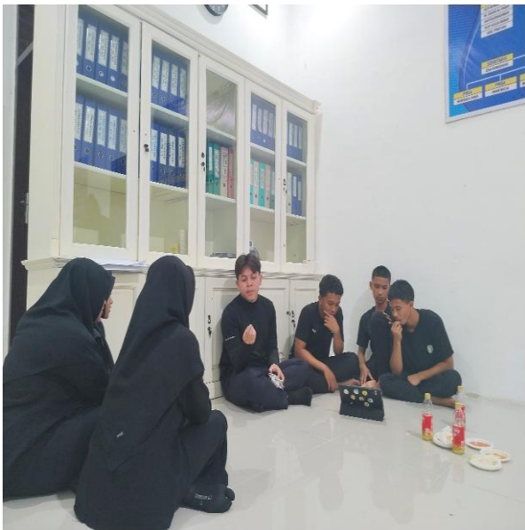
Gambar 6. Briefing dengan Aktor