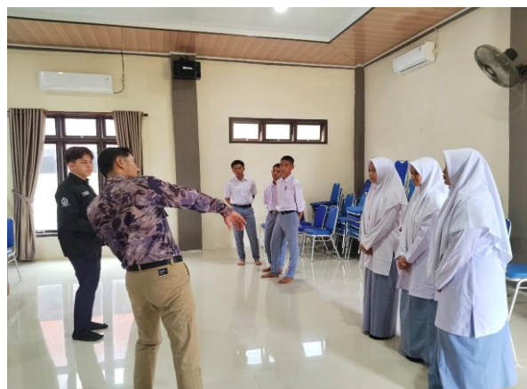
Gambar 4: Praktik Teater

Pada hari berikutnya, peserta dibagi ke dalam dua kelompok, yaitu kelompok aktor dan kelompok videografer. Sebelum memasuki sesi praktik, peserta terlebih dahulu memperoleh pembekalan mengenai pembuatan video pembelajaran. Rangkaian kegiatan dimulai dengan penyampaian materi secara teoritis, kemudian dilanjutkan dengan praktik pengambilan gambar sesuai peran masing-masing kelompok, dan diakhiri dengan sesi penyuntingan video sebagai implementasi dari materi yang telah diperoleh.