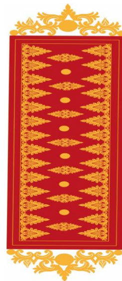
Gambar 7. Hasil Desain Motif yang diaplikasi ke Selendang