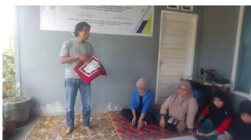
Gambar 1. Penjelasan program kegiatan kepada peserta pelatihan

Melaksanakan kegiatan sosialisasi kepada para perajin melalui penyampaian informasi mengenai program kegiatan serta memberikan bimbingan terkait rancangan yang kreatif dan inovatif, disertai penjelasan mengenai strategi pemasaran secara daring.