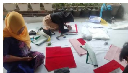
Gambar 3. Memindahkan gambar Alternatif Desain yang sudah dipilih untuk dipindahkan ke media kain

2. Perancangan desain serta pemindahan pola motif sulam benang emas ke media kain utama. (Lihat Gambar. 3).