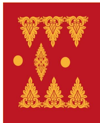
Gambar 4. Desain Motif Kombinasi Motif Pucuk Rabuang dengan Lingkaran.