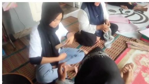
Gambar 2. Menyiapkan Benang sebelum melakukan Sulaman.

1. Menyiapkan berbagai peralatan dan bahan yang digunakan dalam proses perancangan serta pembuatan produk sulam benang emas. Peralatan utama yang dipakai dalam pembuatan kerajinan sulam benang emas di Nagari Koto Baru Kabupaten Solok pada umumnya meliputi pamedangan dan ram , yang berfungsi untuk merentangkan kain saat proses penyulaman motif berlangsung. Selain itu, digunakan pula peralatan pendukung seperti gunting. Bahan pokok yang dimanfaatkan dalam kegiatan kerajinan ini antara lain kain beludru, kain satin, menyiapkan benang emas, benang perak, dan benang suto. (Lihat Gambar 2).