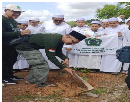
Gambar 4. Penanaman pohon

Setelah edukasi, kegiatan dilanjutkan dengan aksi penanaman 350 bibit pohon di area pesantren Nurul Azhar, meliputi jenis pohon petai, sengon, jengkol, pinang, mahoni, alpukat, manga, rambutan dan. Santri dibagi dalam kelompok dan didampingi fasilitator saat proses penanaman. Setiap pohon diberi label nama penanam untuk menumbuhkan rasa tanggung jawab dan ikatan personal dengan tanaman tersebut (Gambar 4).