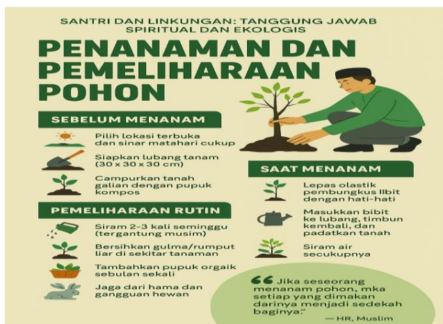
Gambar 3. Flyer Penanaman dan Pemeliharaan Pohon

Sosialisasi juga menampilkan flyer menanam pohon yang ditampilkan pada Gambar 3 di bawah ini.