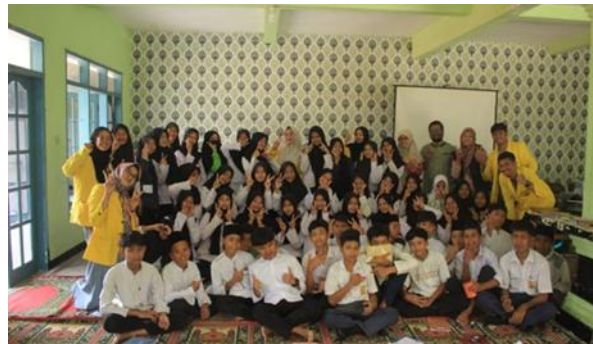
Gambar 1. Penyuluhan Sosialisasi Bahaya Narkoba di SMP Al-Fakhriyah Desa Banjarsari, Ciawi-Bogor.

kegiatan penyuluhan dan serangkaian kegiatan lainnya.