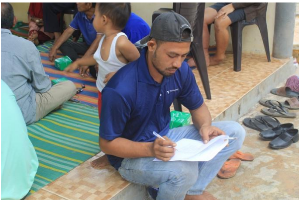
Gambar 4: Kegiatan Post test setelah penyuluhan