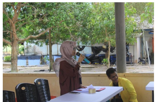
Gambar 2: kegiatan penyuluhan

Pada tahap ini dilakukan kegiatan penyuluhan tentang pencegahan dan penanganan hipertensi, pada tahap ini tim PKM menggunakan media leaflet dikarenakan tempat penyuluhan tidak memungkinkan menggunakan infokus karena pencahayaan. Para mitra sangat antusias saat diskusi tanya jawab setelah penyuluhan.