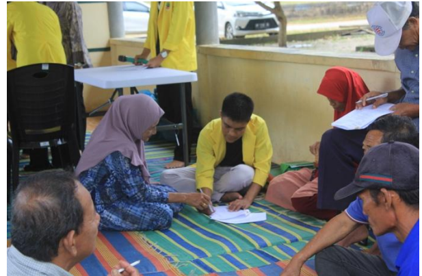
Gambar1: Kegiatan Pre test sebelum penyuluhan

artinya pengetahuan mitra tentang hipertensi dikategorikan sedang.